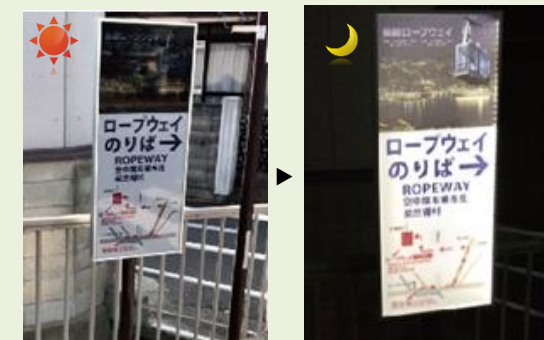
長崎ロープウェイの案内板

長崎ロープウェイでは、近年の夜景ブームにより、夜間に訪れる国内外の観光客が増えています。そのため観光客の利便性を高める目的で当社のデザインソーラーパネルが採用されました。美しい街並みの景観を損ねず、夜間でも視認性が高い点で評価いただいています。観光地のクリーン化取り組みの一環としてPRするツールとしても活用されています。