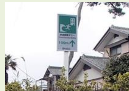
実際設置されたデザインソーラーパネル

地方の市区町村では、看板のメンテナンスを行う人員の確保も難しいことから、市販の単三電池でバッテリー交換が可能な当社製品は非常に喜ばれています。